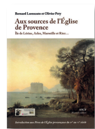
Aux sources de l'Église de Provence Livre