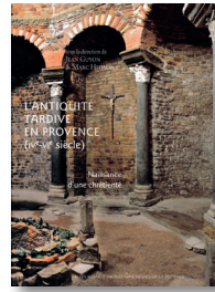
L'Antiquité tardive en Provence Livre